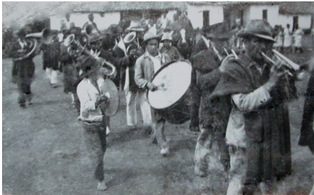
Fig. 10. Banda de Pueblo, años 40 o 50 aprox.

Las misas y procesiones ya no pasan por la parte frontal del pretil sino que toman la calle oriental para ingresar a la iglesia, de igual forma la salida de la procesión y los asistentes a misa se la realiza por la misma calle. Esta situación, por ejemplo, marca la pauta de un cambio en los usos de ese espacio.