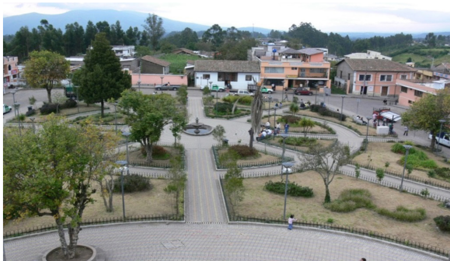
Fig.1. Forma actual del Parque de Píntag, después de la intervención del FONSAL en el Año 2006. Vista desde el campanario de la iglesia.

Las flores y los jardines, los pasajes con adoquín, la pileta y su eje central, las bancas y las lámparas que iluminan en la noche el lugar son la imagen de la versión creada luego de las varias intervenciones