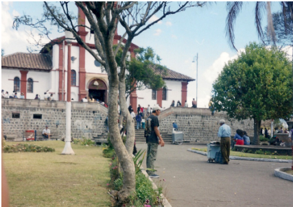
Fig. 13. Imagen del parque sin las rejas de hierro antes de la regeneración del FONSAL.