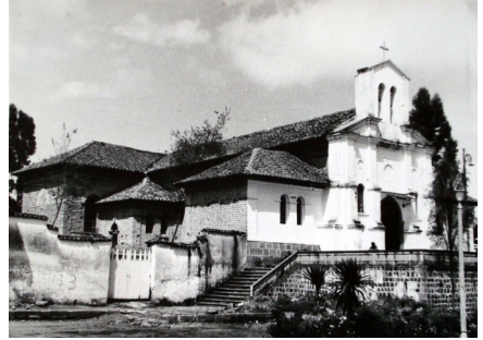
Fig. 7. Vista antigua de la fachada y pretil de la iglesia.