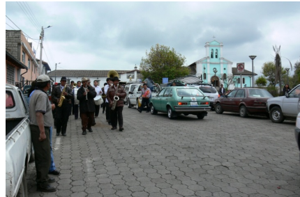
Fig. 11. Banda de Pueblo en la calle lateral del parque.