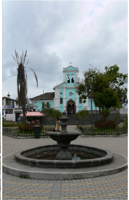
El parque de Pintag.