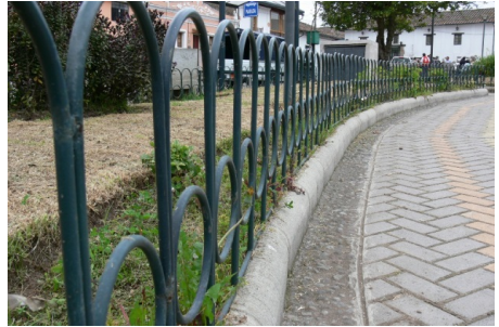
Fig. 14. Imagen de la formulación con rejas luego de la intervención.