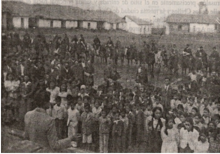
Fig. 6. Evento público, impreso en los años 50 del siglo pasado aprox..