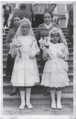
Fig. 8. Primera comunión de las primas Santillán, foto tomada en los años 60 del siglo pasado.

- Era bien bonito antiguamente pero hoy es puro palos como monte, no hay gracia de parque (...) a nosotros de aquí del parque no nos gusta”. (Clara Páez).