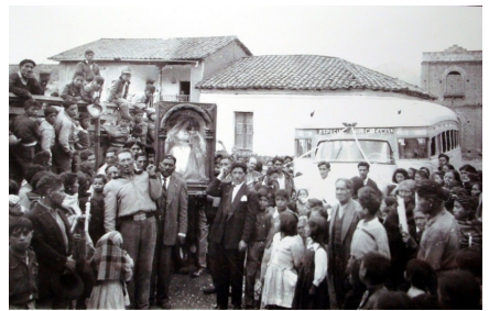
Fig. 9. Evento religioso, 1960 aproximadamente.